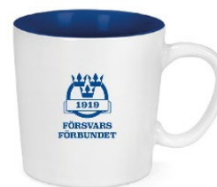
Mugg, 25 kr (ord. 35 kr)

https://www.forsvarsforbundet.se/material-avtal/profilprodukter/ .